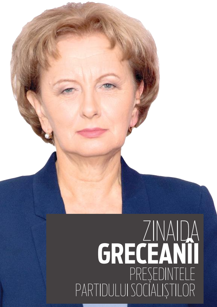
ZINAIDA GRECEANII PREȘEDINTELE PARTIDULUI SOCIALIȘTILOR